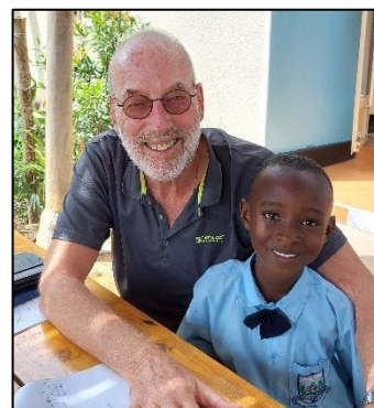
Arent met zijn naamgenoot

We hadden de kinderen uitgenodigd om naar Villa Katwe te komen en het was heel leuk om de kinderen nu één op één te spreken met een flesje frisdrank erbij. Ze zaten ontspannen te vertellen over hun ervaringen op school, de vakken die ze gemakkelijk of moeilijk vonden, wat ze graag in hun vrije tijd doen, maar vooral over hun toekomstdromen. De meesten hadden een realistisch beeld van hun mogelijkheden, maar sommigen moesten we even helpen 'de voeten op de vloer' te houden: de universiteit is niet voor iedereen haalbaar en dan kan een mbo- of hbo-opleiding een betere optie zijn.