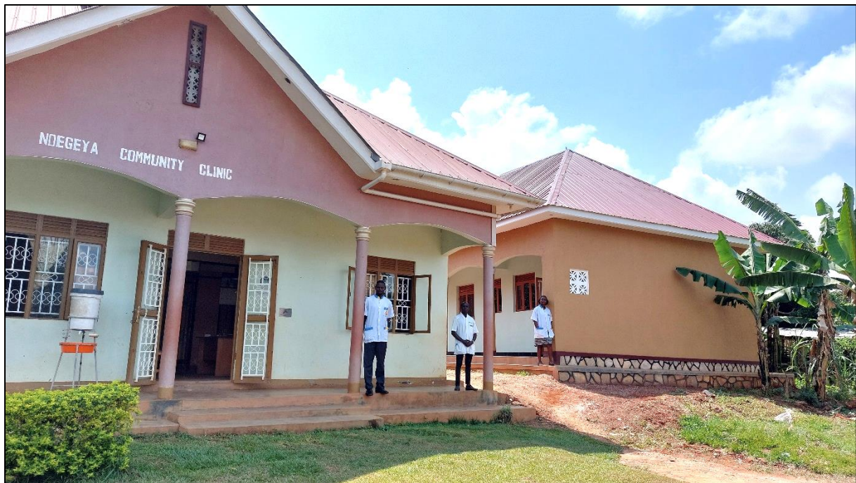
Links de kliniek en rechts het nieuwe Mother and Childcare Centre